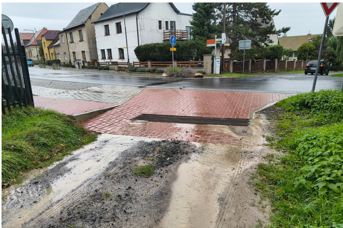
Erozní smyv v Malých Žernosekách

Obec Malé Žernoseky byla zvolena jako pilotní lokalita pro realizaci modrozelené infrastruktury a revitalizačních opatření díky své poloze v krajinářsky cenné a zároveň environmentálně zatížené oblasti Dolního Poohří. Lokalita reprezentuje typické problémy menších obcí v Česku – kombinaci klimatických rizik (sucho, přívalové srážky), narušené vodní dynamiky a potřeby lepšího hospodaření s vodou v urbanizovaném i příměstském prostoru.