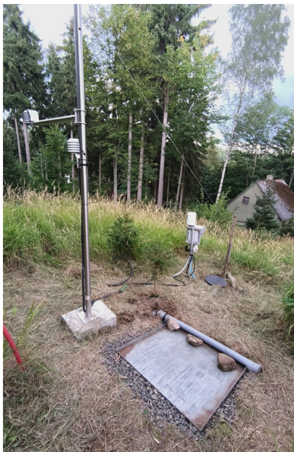
Meteorologická stanice Alšovka

Lokalita umožňuje sledování změn dynamiky hydrometeorologických veličin v horských oblastech v rámci změny klimatu v návaznosti na kalibraci a validaci sněhových komponent hydrologických modelů. Poskytuje unikátní příležitost pro dlouhodobé sledování změn hydrometeorologických veličin v horských oblastech Ústeckého kraje. Monitoring výšky sněhové pokrývky, teploty vzduchu a půdy, vodního režimu a infiltrace do půdy umožňuje provádět kalibraci hydrologických modelů s důrazem na sněhovou komponentu, což je klíčové pro predikce odtokových scénářů v měnícím se klimatu.