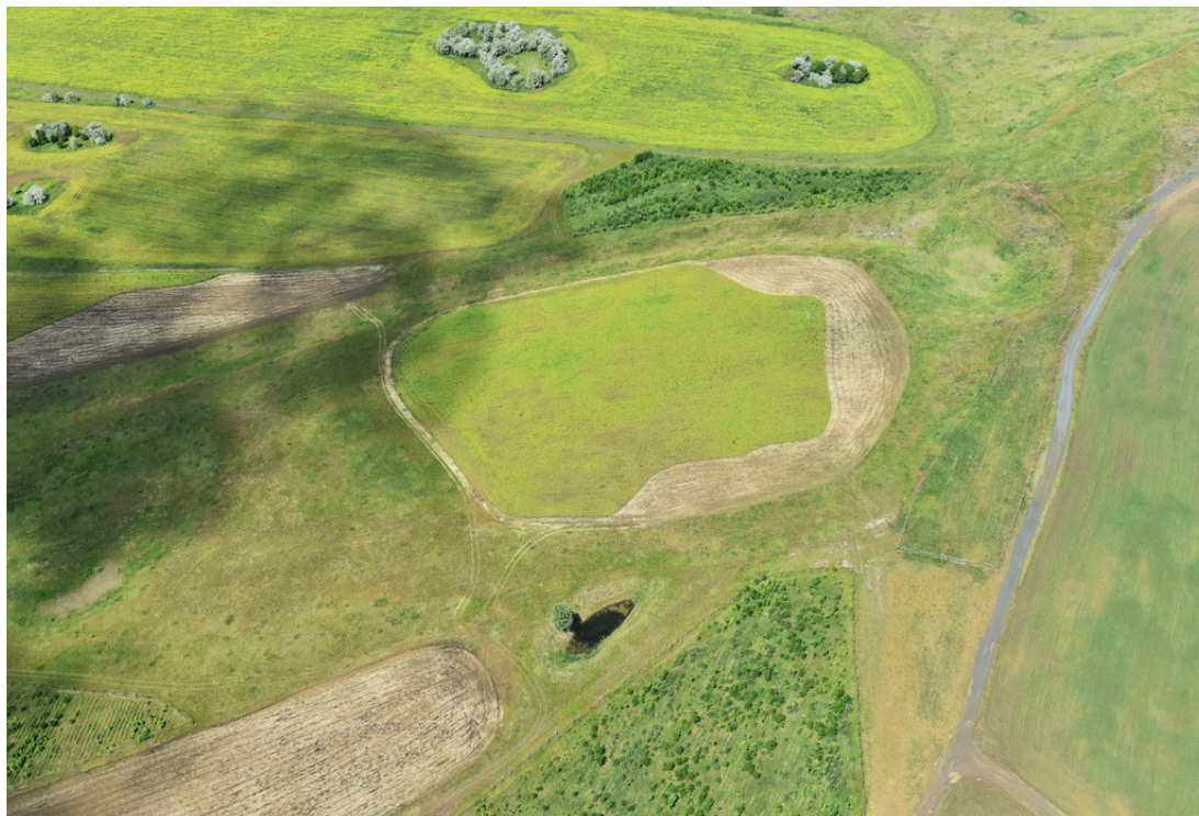
Letecký pohled na lesnickou a zemědělskou rekultivaci s remízky na Vršanech

v regionu, kde se v dohledné době očekává ukončení těžby. Lom Vršany tak umožňuje nejen testování konkrétních řešení v podmínkách rozsáhlého a členitého území, ale i jejich následné využití při obnově dalších lokalit postižených těžbou.