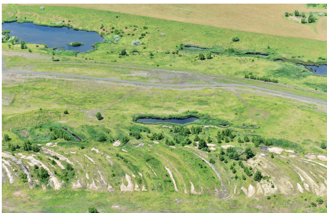
Letecký pohled na sukcesní plochy s přirozenými propadlinami na Vršanech

v regionu, kde se v dohledné době očekává ukončení těžby. Lom Vršany tak umožňuje nejen testování konkrétních řešení v podmínkách rozsáhlého a členitého území, ale i jejich následné využití při obnově dalších lokalit postižených těžbou.