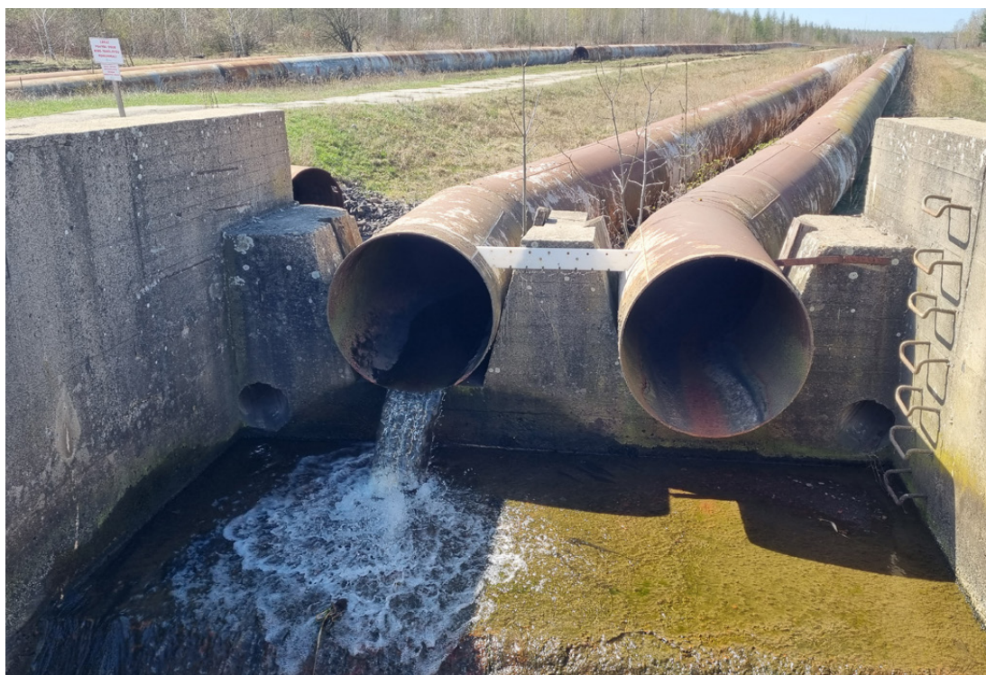
Vyústění potrubí z Ervěnického koridoru