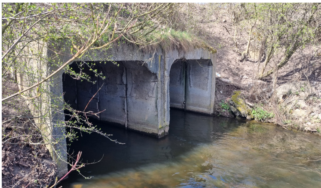
Ervěnický koridor, propustek