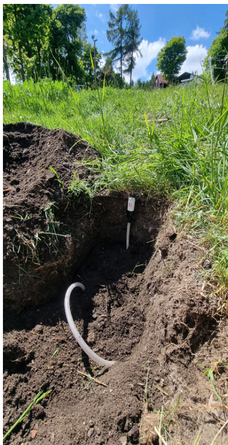
Monitoring vlhkosti půdy na lokalitě Alšovka – Měděnec