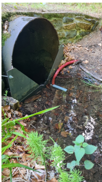
Alšovka, vodoměrný profil dolní