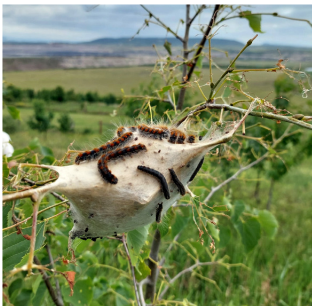
Bourovec březový na Vršanech

Inovativní řešení obnovy posttěžební krajiny využitelné člověkem, biologicky cenné a klimaticky odolné.