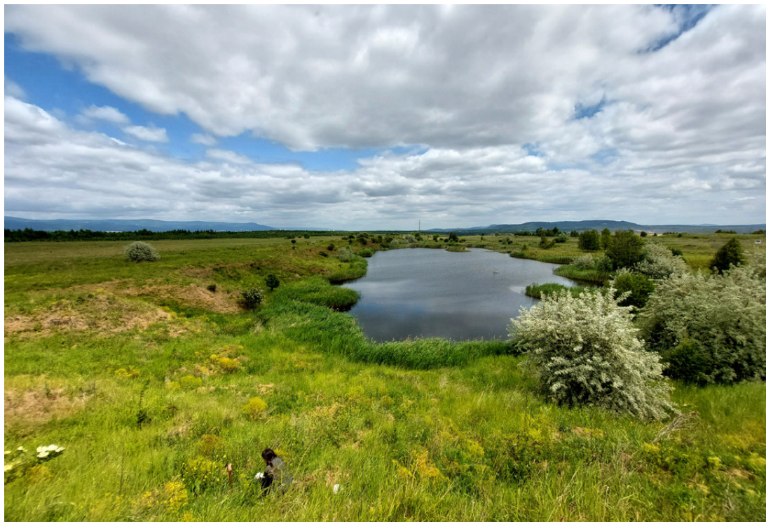
Jedna z mnoha vodních ploch Vršan