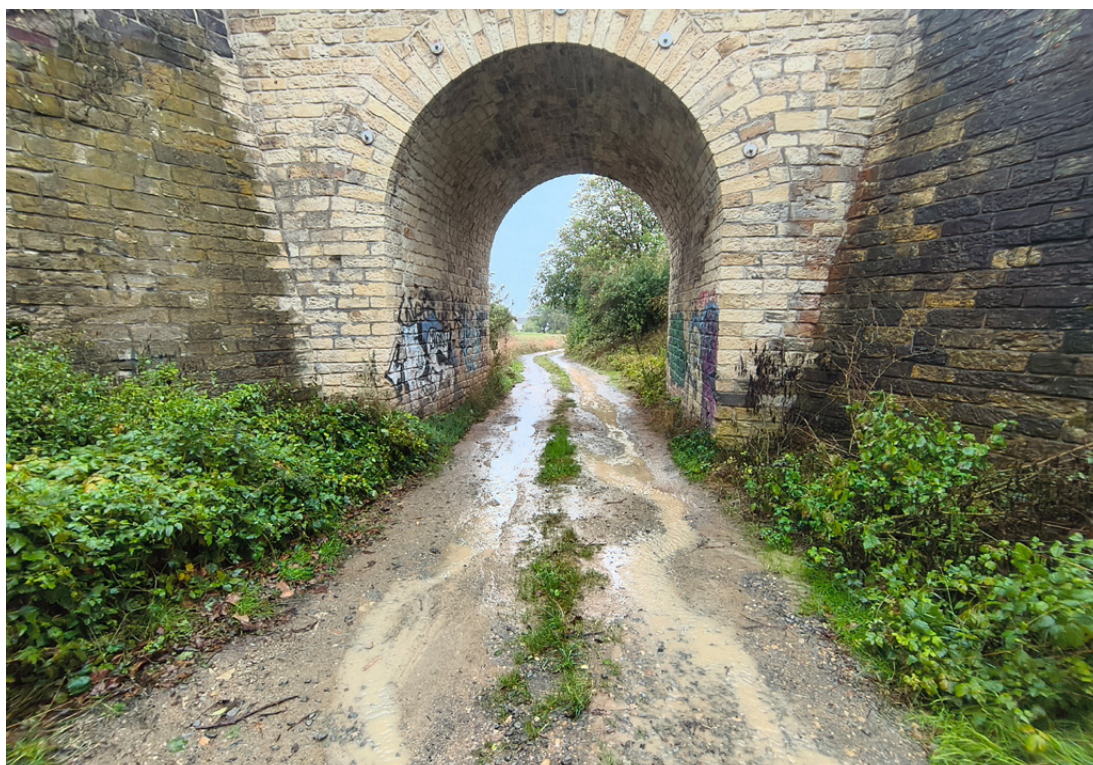
Další příklad erozivní události v Malých Žernosekách