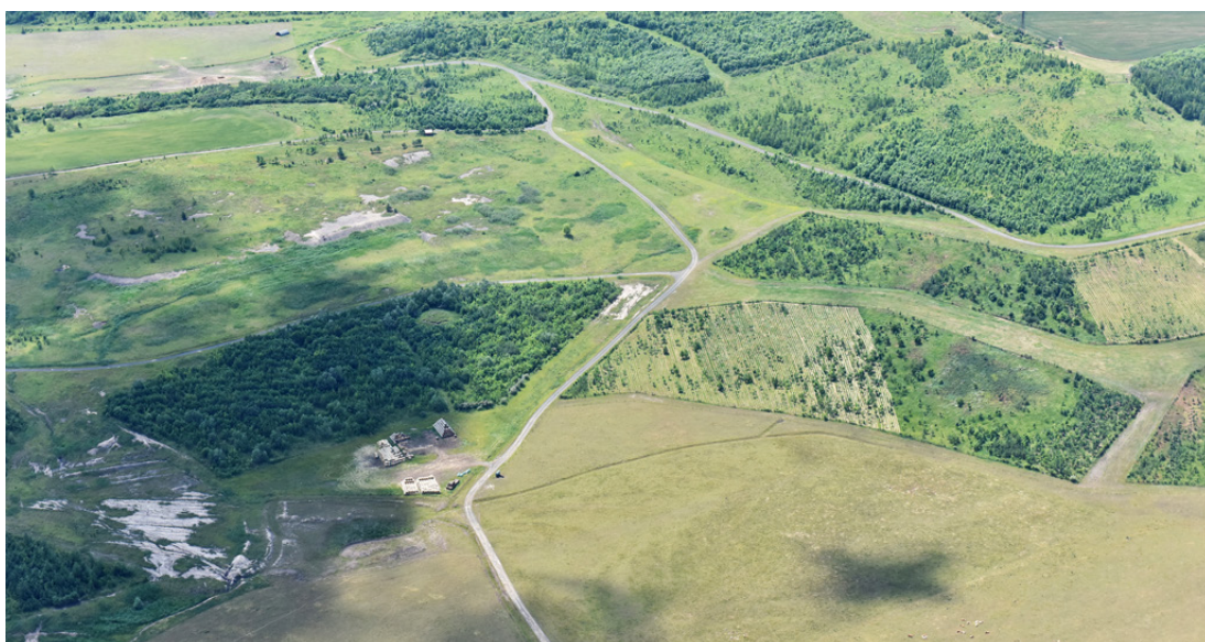
Letecký pohled na rekultivované území Vršan

letech byly přímo na výsypce registrovány tři nové významné krajinné prvky, kde je předmětem ochrany proces ekologické sukcese a velké množství chráněných druhů, zejména bezobratlých, obojživelníků a ptáků. Dále se předpokládá, že během řešení projektu bude vyhlášena nová národní přírodní památka s obdobnými charakteristikami, jako mají výše zmíněné VKP. Více jak polovina území prošla technickými a biologickými rekultivacemi, které představují nejčastěji lesy ve svažitých částech a zemědělské pozemky (orná půda, pastviny, TTP), část již nasypaného terénu je bez rekultivace a je osidlována samovolně, v části probíhá aktivní skrývka nadloží, těžba a sypání vnitřních výsypek.