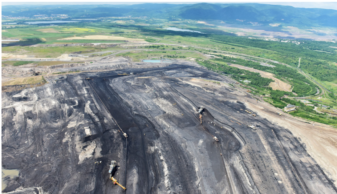
Letecký pohled na území aktivní těžby na Vršanech

letech byly přímo na výsypce registrovány tři nové významné krajinné prvky, kde je předmětem ochrany proces ekologické sukcese a velké množství chráněných druhů, zejména bezobratlých, obojživelníků a ptáků. Dále se předpokládá, že během řešení projektu bude vyhlášena nová národní přírodní památka s obdobnými charakteristikami, jako mají výše zmíněné VKP. Více jak polovina území prošla technickými a biologickými rekultivacemi, které představují nejčastěji lesy ve svažitých částech a zemědělské pozemky (orná půda, pastviny, TTP), část již nasypaného terénu je bez rekultivace a je osidlována samovolně, v části probíhá aktivní skrývka nadloží, těžba a sypání vnitřních výsypek.