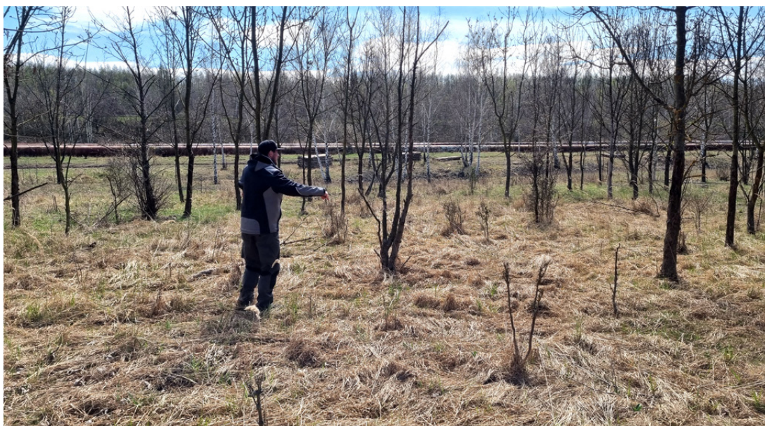
Umístění meteorologické stanice v Ervěnickém koridoru

Hlavní zaměření zde spočívá v hydrologickém managementu vody a vlivu na klima, dále pak sledování vlastního procesu revitalizace či jeho ovlivnění v dynamice rostlinných i živočišných druhů.