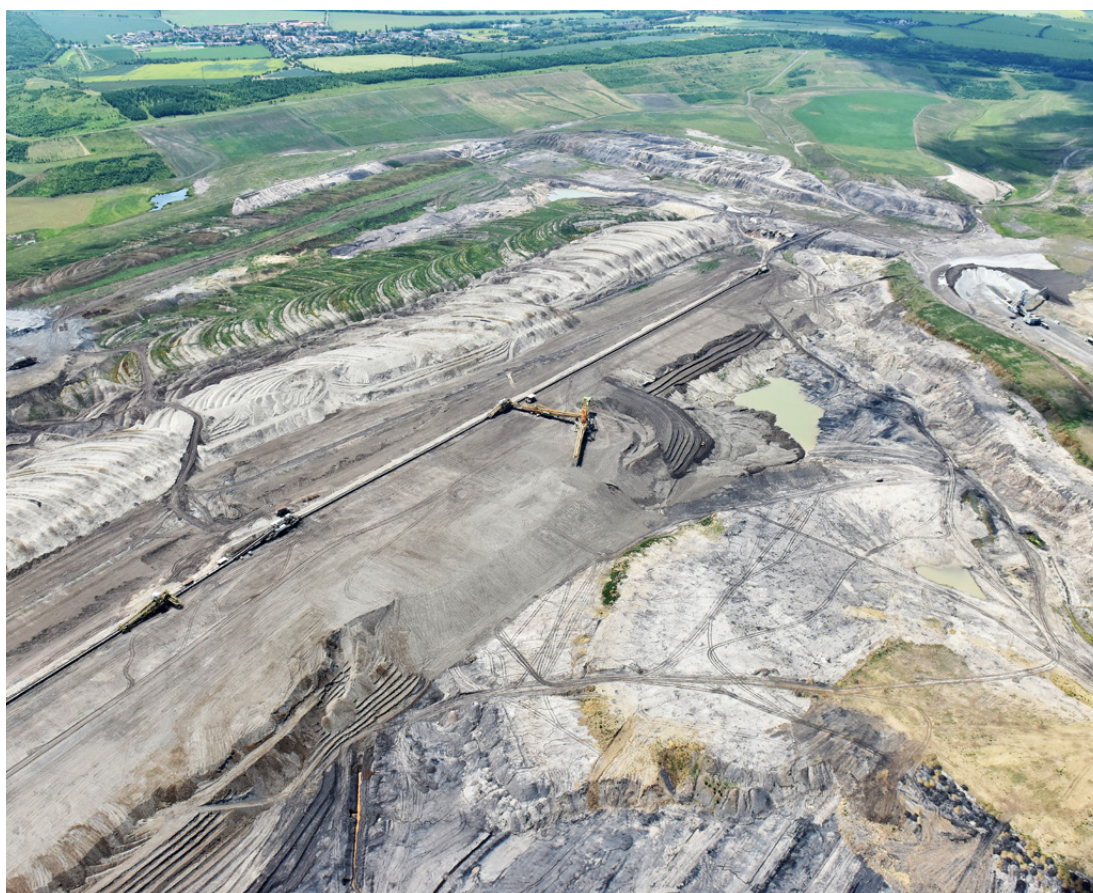
Letecký pohled na Vršany

Díky své rozloze a terénní členitosti nabízí lom vhodné podmínky pro návrh a ověřování různých typů zásahů a pro hodnocení jejich efektivity.