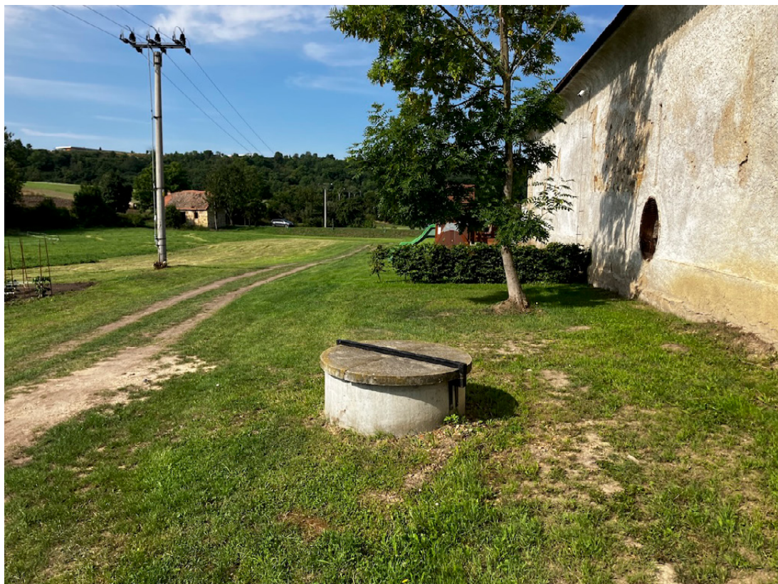
Vodní audit pomocí vrtu v Kostelci nad Ohří

Kostelec nad Ohří je malá obec v okrese Litoměřice, ležící na levém břehu Ohře, v zemědělsky využívané krajině na okraji Českého středohoří. Obec s přibližně 200 obyvateli je charakteristická klidným venkovským prostředím a přílehlými loukami, poli a remízky. V blízkosti se nachází bezejmenný vodní tok napojený na zavlažovací systém, který v minulosti sehrával klíčovou roli v místním hospodaření. Lokalita čelí dopadům klimatických změn, zejména suchu a ztrátě retence vody v krajině. Vzhledem ke kombinaci kulturní krajiny, nízké urbanizace a přímé vazby na zemědělské aktivity nabízí Kostelec nad Ohří vhodné podmínky pro testování přírodě blízkých opatření a obnovu ekologických funkcí území.