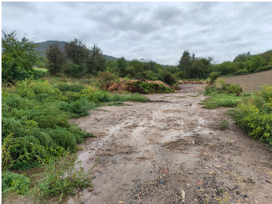
Další příklad erozivní události v Malých Žernosekách